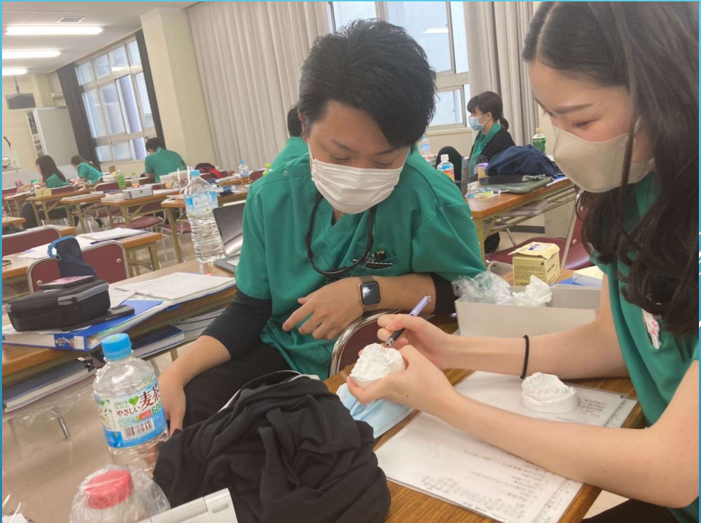
AGUD Residency Program 2026