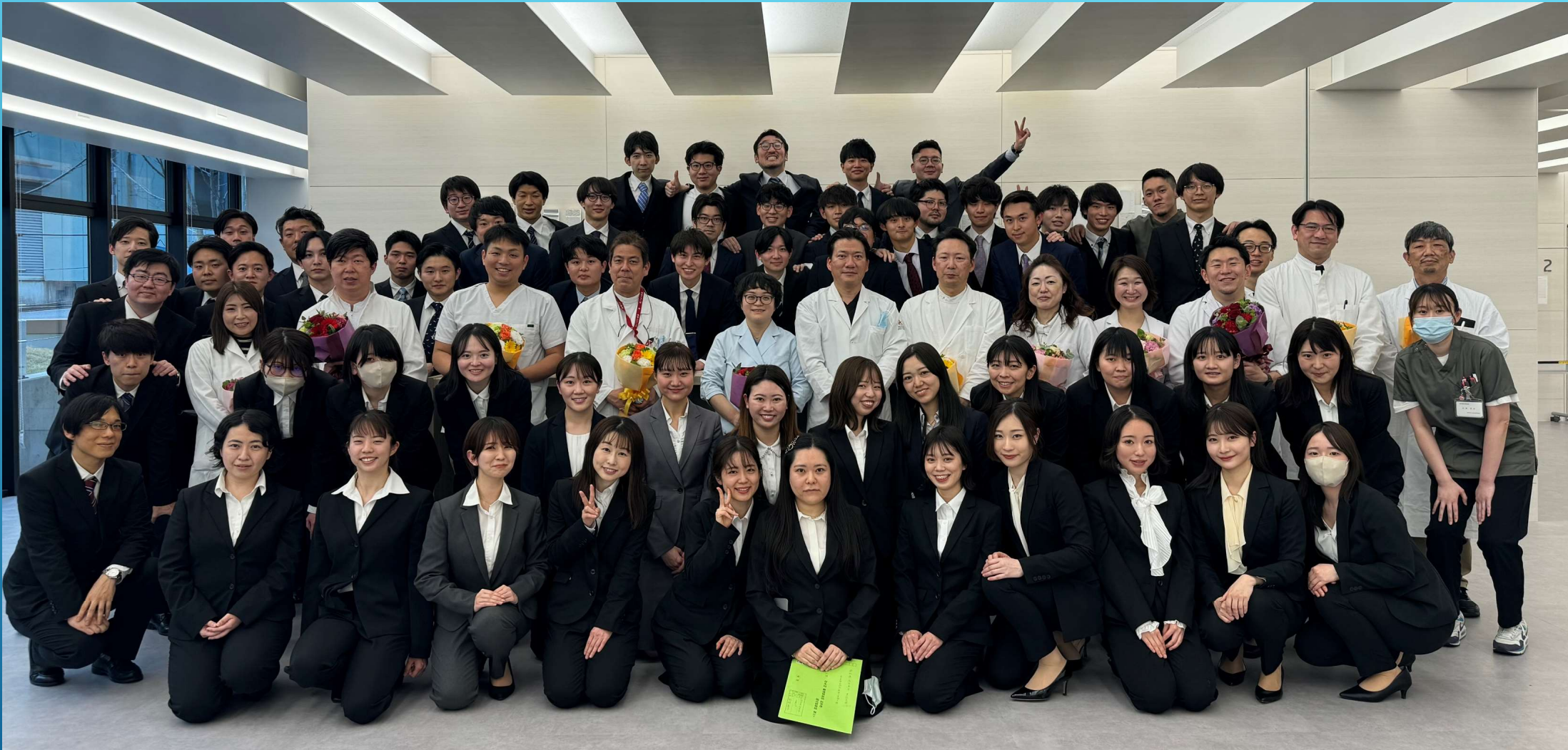
AGUD Residency Program 2026